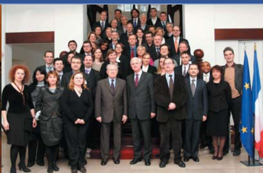
Promotion « Jacques Delors » à l'École nationale d'administration, Paris, février 2008