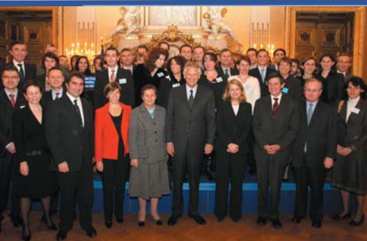
Promotion « Simone Veil » au Salon de l'Horloge, Ministère des affaires étrangères, Paris, janvier 2007.

Un cycle au service des décideurs de l'Europe de demain