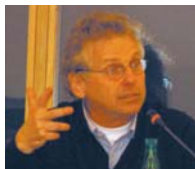
Daniel COHN-BENDIT, Député européen en débat au Parlement européen avec les auditeurs de la promotion « Valéry Giscard d'Estaing », Strasbourg, le 10 mars 2009 (Copyright : ENA).