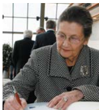
Simone VEIL, marraine de la promotion 2007 (Copyright : Parlement européen - Unité Audiovisuelle).