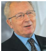
Jacques DELORS, parrain de la promotion 2008 (Copyright : European Community).