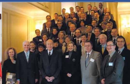
Promotion « Valéry Giscard d'Estaing » à Belle Église (France), janvier 2009.

Vous êtes cadre de haut niveau dans une entreprise, haut fonctionnaire, élu, journaliste, syndicaliste, membre d'une institution internationale ou acteur de la société civile ;