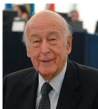
Valéry GISCARD D'ESTAING, parrain de la promotion 2009.