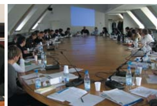
Réunion des auditeurs de la promotion « Jacques Delors » dans la Salle du Conseil d'administration de l'Ena, Strasbourg, mai 2008.